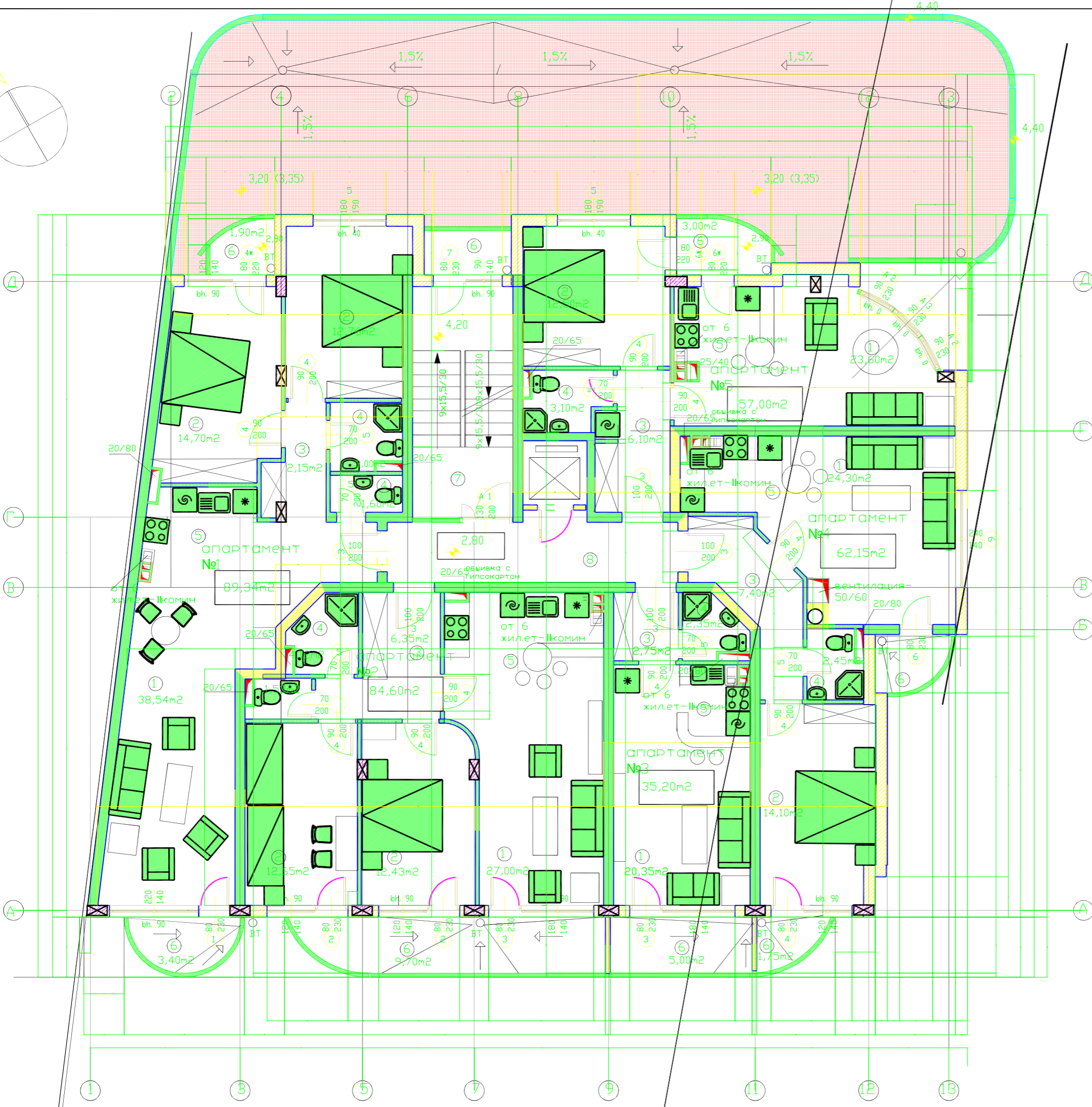
ТАБЛИЦА ЗА ОБРАБОТКА НА ПОМЕЩЕНИЯТА