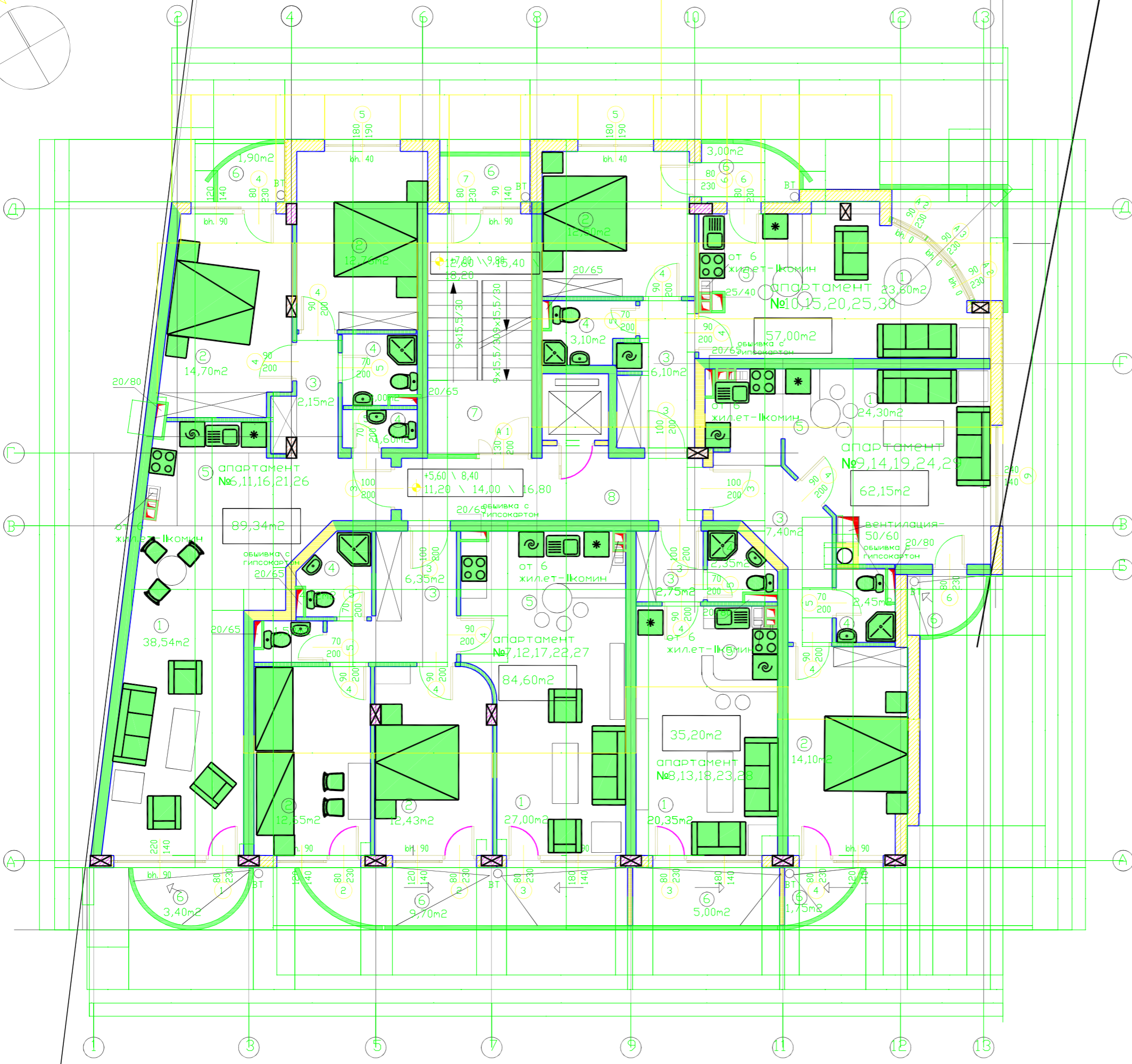
ТАБЛИЦА ЗА ОБРАБОТКА НА ПОМЕЩЕНИЯТА